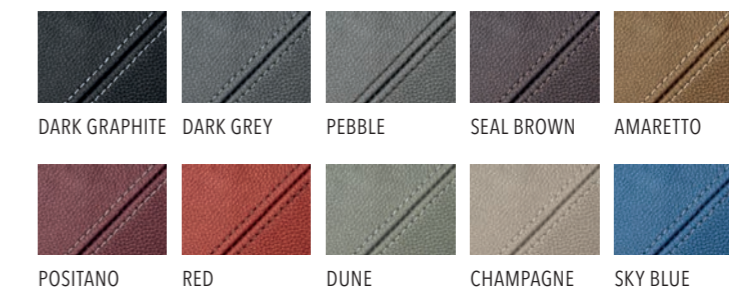
DARK GRAPHITE DARK GREY PEBBLE SEAL BROWN AMARETTO POSITANO RED DUNE CHAMPAGNE SKY BLUE