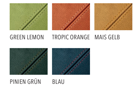
GREEN LEMON TROPIC ORANGE MAIS GELB PINIEN GRÜN BLAU

** Alle Farben können auch miteinander kombiniert werden. Die Preise für die „Klassische Ausstattung“ entnehmen Sie bitte der aktuellen Broschüre „Preise, Technische Daten, Ausstattung“. Die Preise für „Individuelle Farbakzente“ erfragen Sie bitte bei Ihrem Subaru Partner.